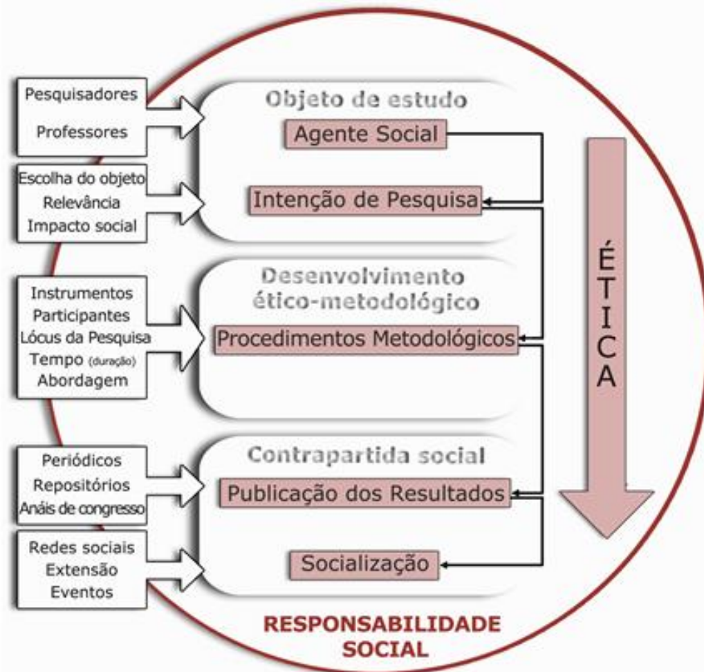
Fig. 1. Processo de responsabilidade social do pesquisador. In: Lima, Brasileiro, Menezes, Garcia, 2012