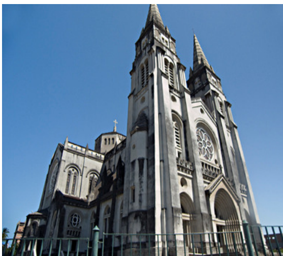
Catedral da Sé