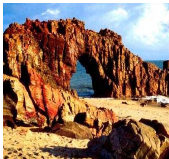
Praia de Canoa Quebrada