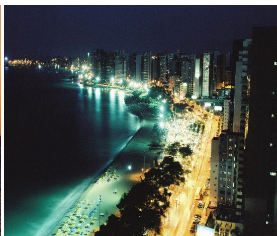
Vista noturna da Av. Beira Mar