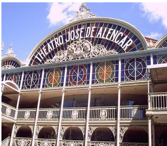
Teatro José de Alencar